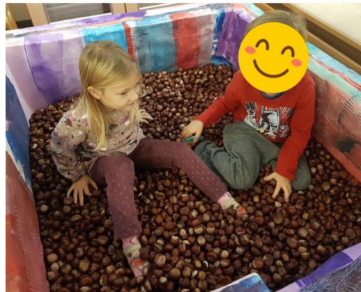
Kastanienbad (aus leeren Corona Testschachteln)