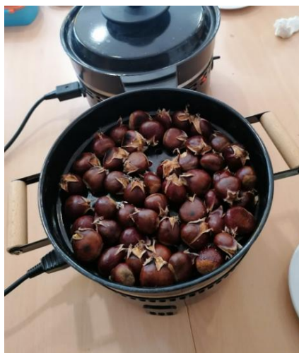
Maroni sammeln, rösten, genießen