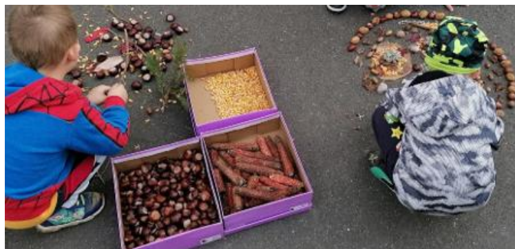
Mandalas und Formen aus Naturmaterialien